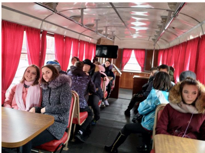
1.att. Jaunie atklājumi no tramvaja loga