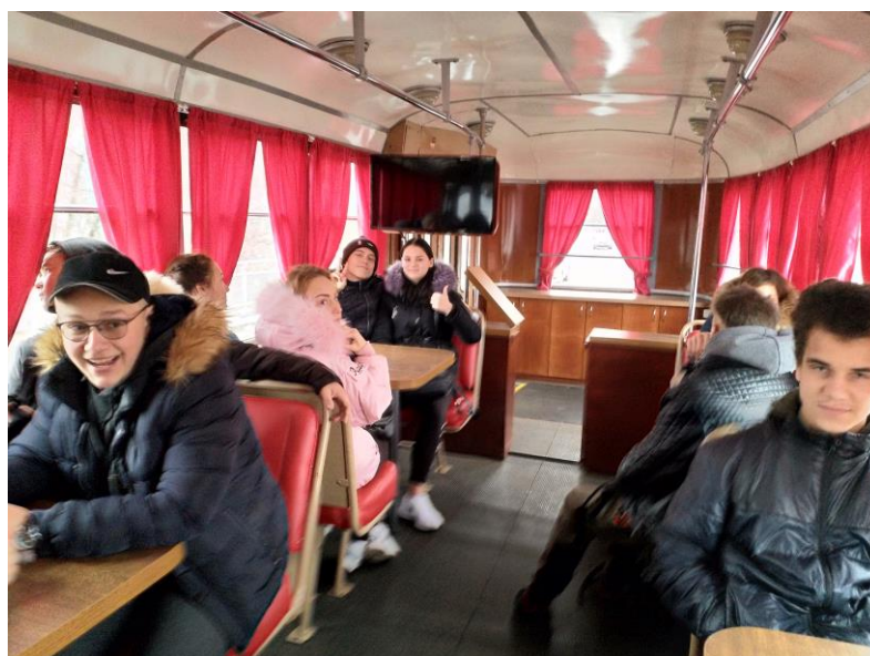
2.att. Mēs kopā – neatņemama nacionālās identitātes sastāvdaļa