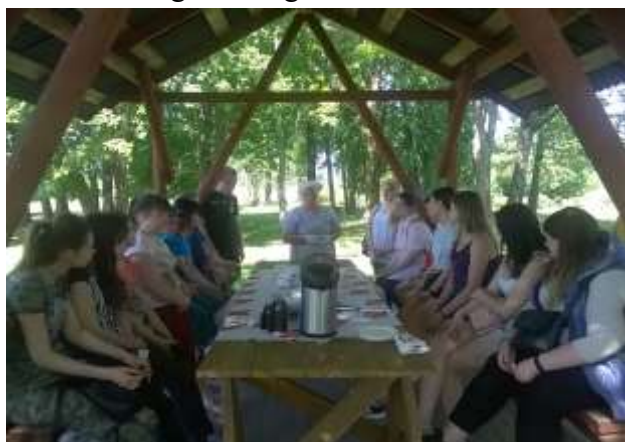
zīm.4. Stāsts par ievārījumiem