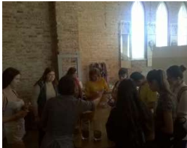
zīm.7. Endorfīnu laboratorija