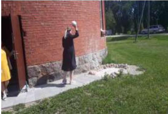
zīm.8. Sist traukus – uz Laimi