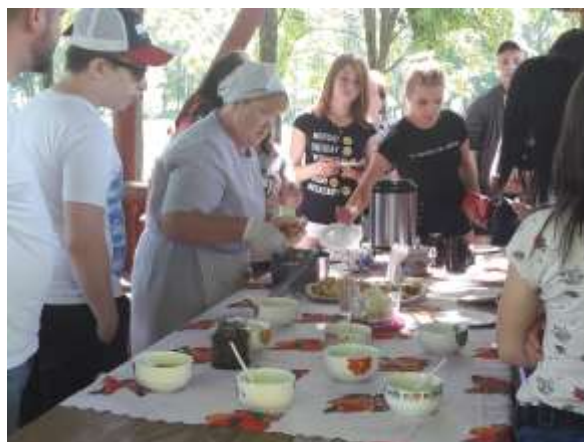
zīm.5. Ievārījumu degustācija