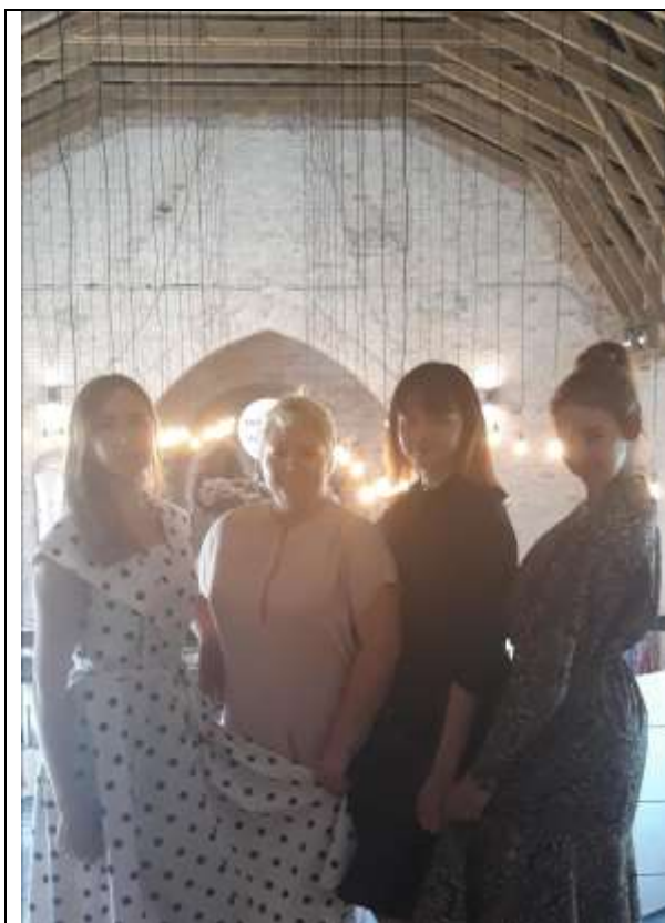
zīm.3. Pastaiga 70-to gadu kleitās