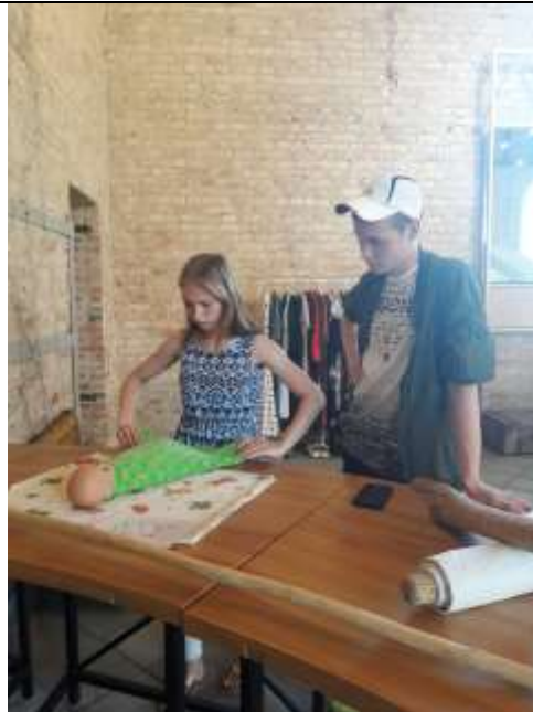
zīm.9. Bērni – mūsu Laime

Jefimova T.:” Ļoti patika “Laimes muzejs”, kur pie katra eksponāta bija uzdevums, ko mēs ar lielāko prieku pildījām. Varēja pārgērbties 70-to gadu kleitās pastaigāt pa muzeju”.