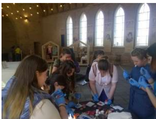
zīm.6. Radošais darbs – uzzīmē savu māriti